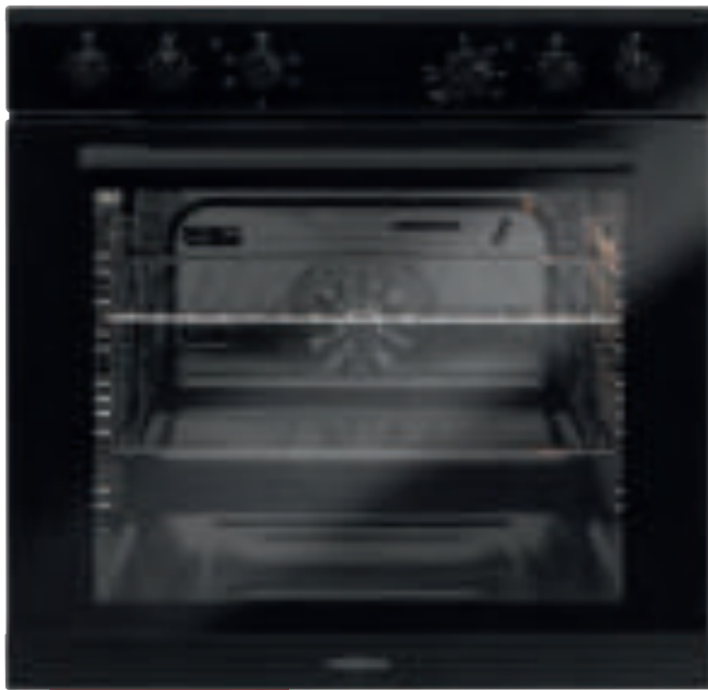
XL-Backraum 78 l