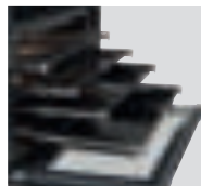
Großer Backraum mit 9 Einschubebenen kann mit bis zu 4 Vollauszügen ausgestattet werden.