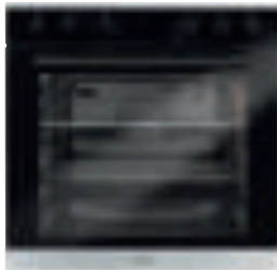
EBH 9913, Ausführung Edelstahl