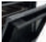
fullCLEAR-Door mit fineLINE Griff