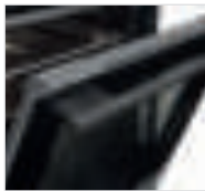
fullCLEAR-Door mit fineLINE Griff